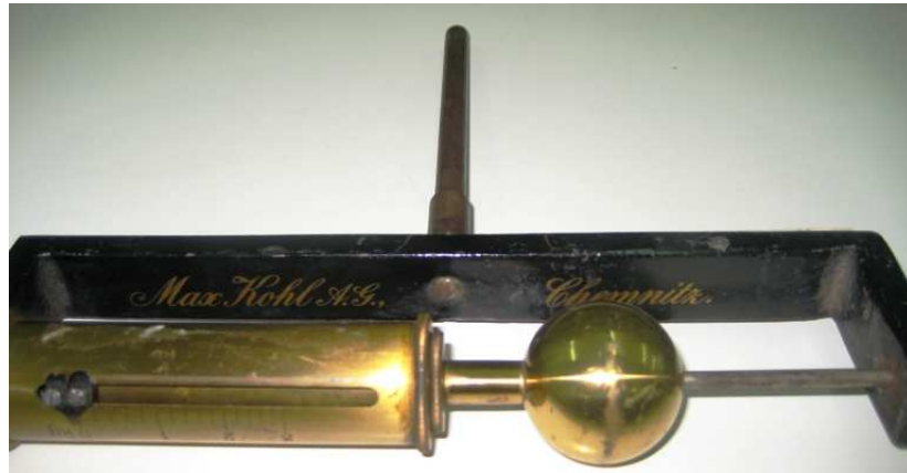
Sello del Fabricante: Max Kohl A.G., Chemnitz